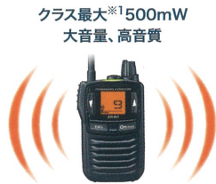
クラス最大※1 500mW 大音量、高音質

※1 国内で販売されている単3形乾電池仕様/スピーカ内蔵の特定小電力トランシーバーとして