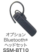
オプション Bluetooth® ヘッドセット SSM-BT10

オーディオアクセサリを接続するコネクタは、無線機の側面に配置しボリューム調整やチャンネル切替えなどの操作を妨げません。また、上下2点をしっかり固定するプロ仕様のコネクタを採用しているため、衝撃や引っ掛けによるコネクタ外れや接触不良による通信のトラブルを防ぎます。