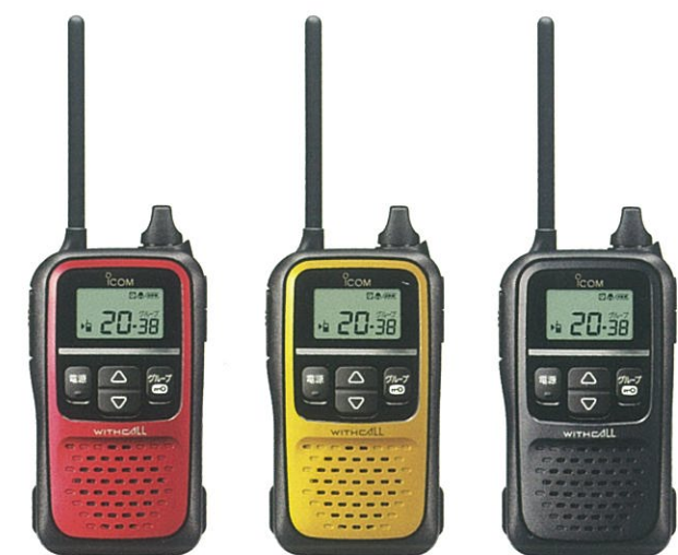
メタリックレッド JANコード:4909723122296 メタリックイエロー JANコード:4909723122289 ブラック JANコード:4909723122272

携帯電話にない同報性が、スタッフ間の連絡効率向上、お客様へのすばやい対応をサポートします。