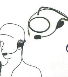
HS-95 ※VS-2Lが必要 ネックアーム型ヘッドセット 12,000円+税 JANコード:4909723810032