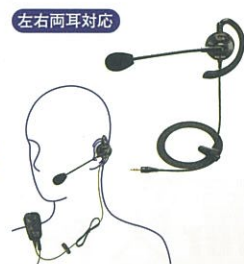
HS-99 ※VS-2Lが必要 耳掛け型イヤホンマイクロホン 4,000円+税 JANコード:4909723009375

ビジネスシーン ・アパレル・フィットネスクラブ ・自動車小売業・ファーストフード など