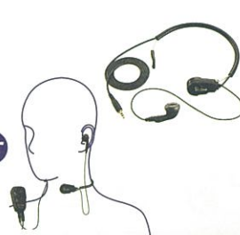
HS-97 ※VS-2Lが必要 咽喉マイクロホン 2,300円+税 JANコード:4909723810926