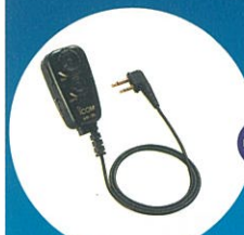
VS-2L PTT・VOXスイッチユニット 3,500円+税 JANコード:4909723009351