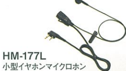
HM-177L 小型イヤホンマイクロホン 3,800円+税 JANコード:4909723007012