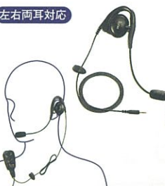
HS-94 ※VS-2Lが必要 イヤークック型ヘッドセット 1,500円+税 JANコード:4909723809920