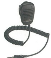
MH-57A4B スピーカーマイク 本体価格4,700円 (税抜)