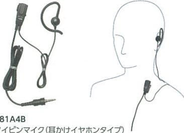
MH-381A4B 小型タイプイヤホンマイク (耳かけイヤホンタイプ) 本体価格3,800円 (税抜)