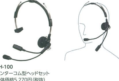
YH-100 インターコム型ヘッドセット 本体価格5,270円 (税抜)

ヘルメットに装着するタイプのヘッドセット ※本体との接続にはCT-87が必要です。