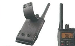
SHC-16 キャリングケース 本体価格1,900円 (税抜)

充電して繰り返し使用できる大容量 Ni-MH電池パック 容量最小値2400mAh/公称値2500mAh