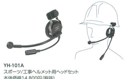
YH-101A スポーツ/工事ヘルメット用ヘッドセット 本体価格14,800円 (税抜)

ヘルメットに装着するタイプのヘッドセット ※本体との接続にはCT-87が必要です。