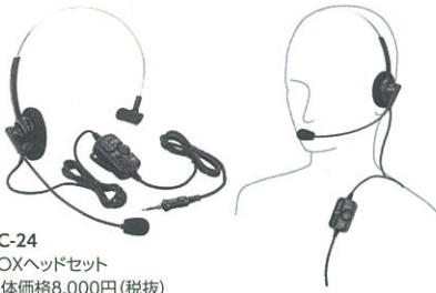
VC-24 VOXヘッドセット 本体価格8,000円 (税抜)