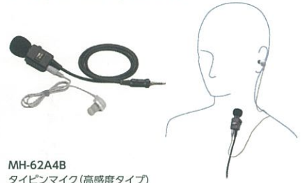
MH-62A4B タイプイヤホンマイク (高感度タイプ) 本体価格6,500円 (税抜)