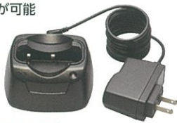
VAC-60 急速充電器セット (付属品と同等) 本体価格2,500円 (税抜)