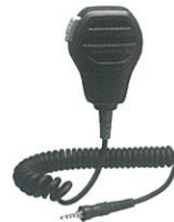
MH-73A4B 防曇型スピーカーマイク 本体価格5,200円 (税抜)