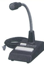
ベース用 スタンドマイクロホン KMC-53