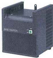
ベース用 スピーカー付き電源 KBS-1