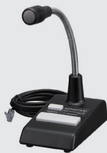
ベース用 スタンドマイクロホン KMC-53